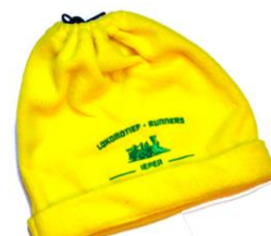
Muts : 7€