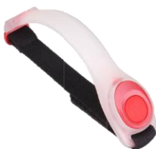
Reflectie armbandjes (per paar 5€)

Ondertussen een maatje meer of minder. Vergeet niet jouw gewijzigde kledijmaat te melden naar roland.outtier@gmail.com